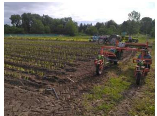
Chantier de plantation des oignons rouges de conservation.