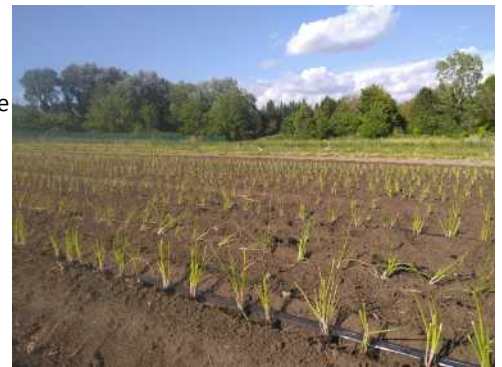
Environ 8000 mottes plantées sur 900m 2 , entre 20 000 et 30 000 oignons récoltables fin septembre, soit environ 3 tonnes à conserver... si tout se passe bien !