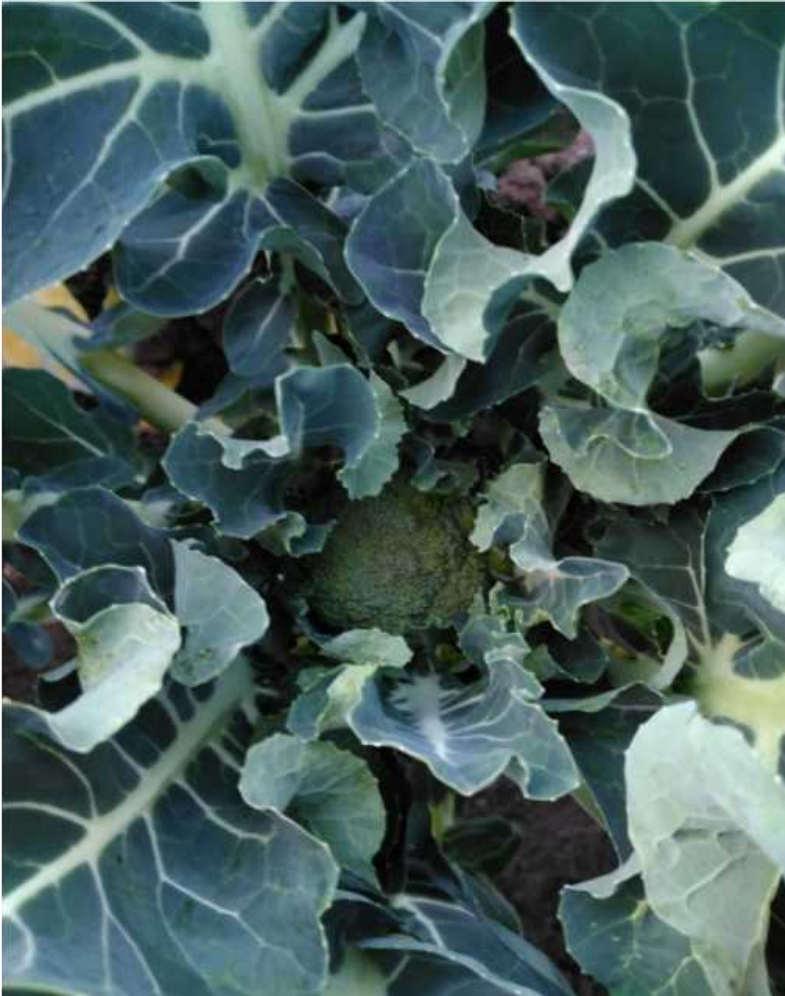
Certains légumes ont quand même de la gueule !